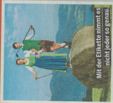
Mit der Etikette nimmt es nicht jeder so genau.

Oktober werden auf beiden Plätzen Handicapverbesserungs-Turniere angeboten, bei denen auch Gäste willkommen sind.